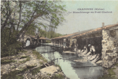
Le Blanchissage au Pont Chabrol

Dès le 18ème siècle, les médecins lyonnais recommandaient "Craponne " pour la santé des nourrissons en raison de son air salubre.