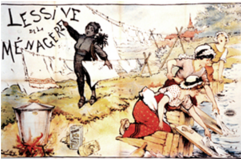
La Blanchisserie

La terre étant pauvre, beaucoup de paysans de Craponne comprirent vite le profit qu'ils pourraient tirer de cette activité de blanchissage qui va donc se développer rapidement.