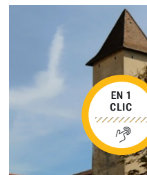
La vieille église