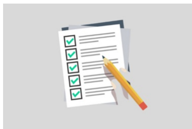
Contacteur un élu