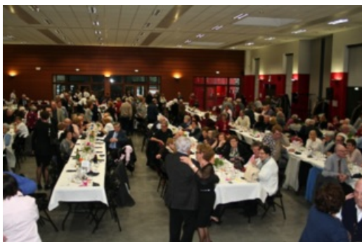
Journée de l'amitié

Trois temps forts sont organisés tous les ans au service des personnes âgées : la journée de l'amitié, la semaine bleue et la distribution des colis de Noël.