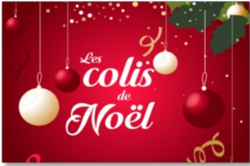
Colis de Noël